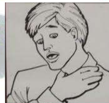
UNIVERSALUS UZSPRINGIMO ZENKLAS