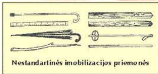
Nestandartinės imobilizacijos priemonės